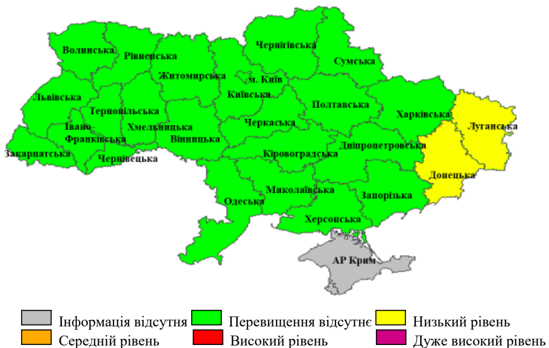
Рис. 3. Перевищення епідемічних порогів захворюваності на грип та ГРВІ серед регіонів, Україна, 40 тиждень 2020 року

У Донецькій та Луганській областях зареєстровано низькі рівні перевищення епідемічних порогів — на 16,0% та 0,2% відповідно. В інших регіонах України активність грипу була на неепідемічних рівнях (рис. 3).