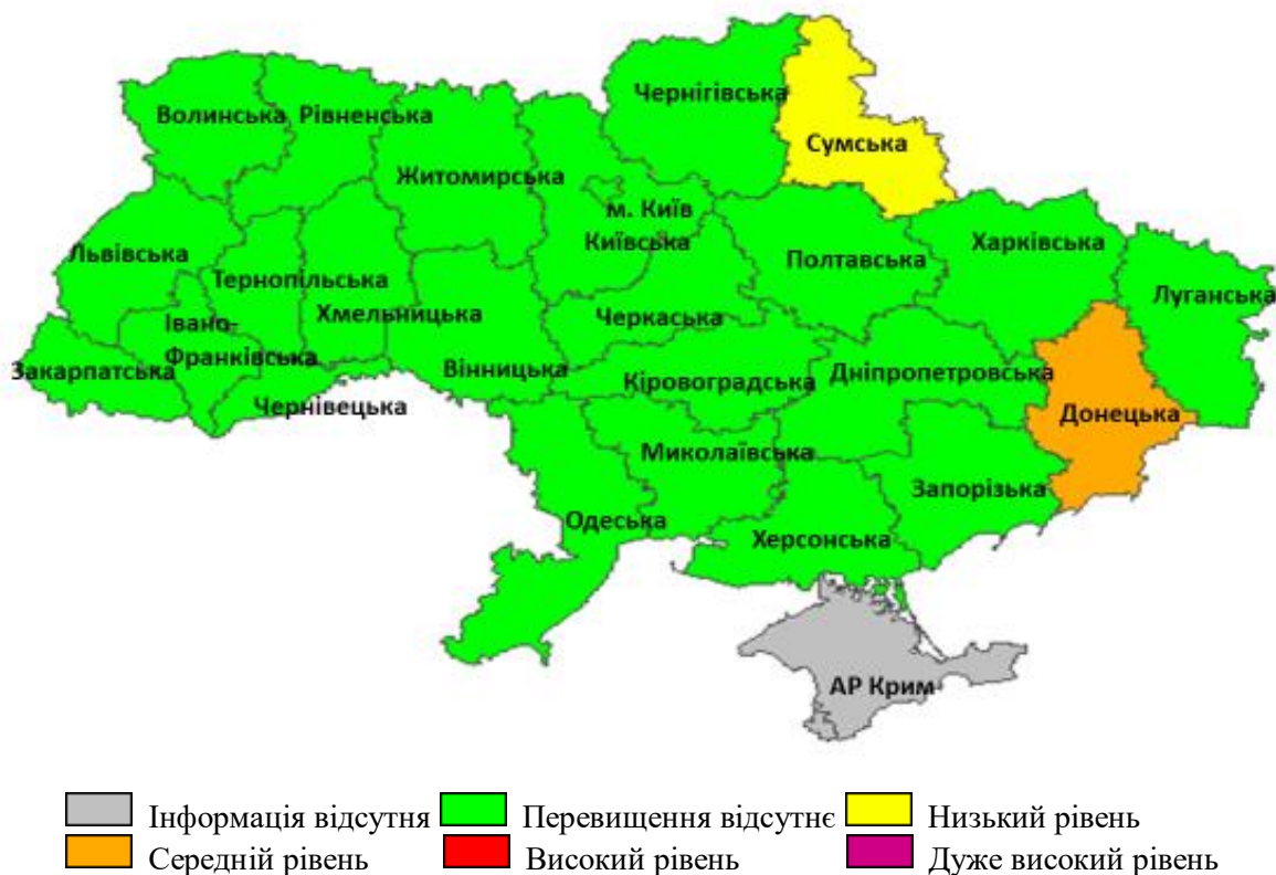
Рис. 3. Перевищення епідемічних порогів захворюваності на грип та ГРВІ серед регіонів України, 42 тиждень 2020 року

У більшості регіонів України активність грипу та ГРВІ була на неепідемічних рівнях, за винятком Донецької області, де зареєстровано середній рівень перевищення епідемічного порога (на 41,9%) та Сумської — з низьким рівнем перевищення епідемічного порога (на 8,6%).