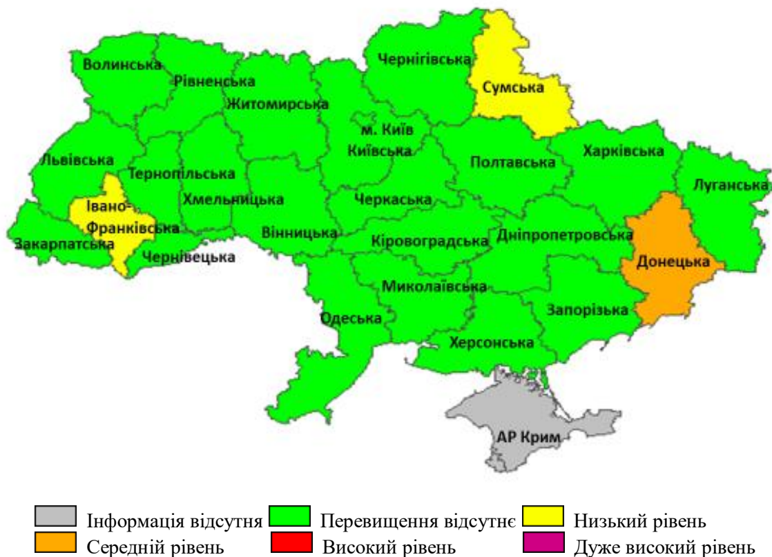
Рис. 3. Перевищення епідемічних порогів захворюваності на грип та ГРВІ серед регіонів України, 43 тиждень 2020 року

У більшості регіонів України був неепідемічний рівень активності грипу та ГРВІ, за винятком Донецької області, де зареєстровано середній рівень перевищення епідемічного порога — на 42,9%, Сумської та Івано-Франківської областей — із низьким рівнем перевищення епідемічного порога, на 18,6% та 10,8% відповідно.