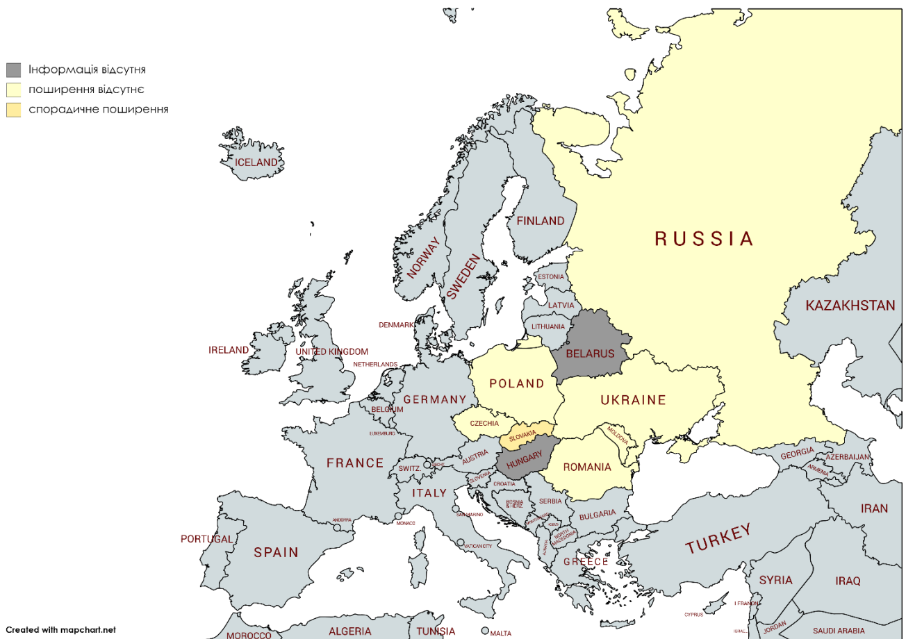
Рис. 1. Адаптовано на основі карти географічного поширення грипу в країнах європейського регіону ( http://flunewseurope.org ) за 42 тиждень 2020 року